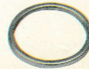
Arm Cone Dust Cap 503364