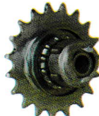
Driving Set 504588