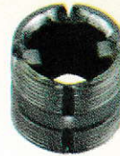
Steel Brake Drum 502593