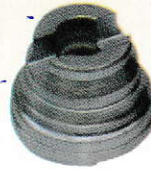
ARM CONE 503365