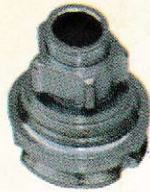
DRIVING SLEEVE 503369