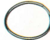
Sprocket Securing Circlip 502621