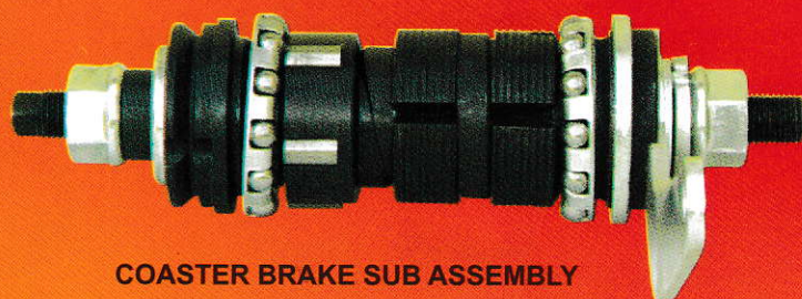
COASTER BRAKE SUB ASSEMBLY REGISTERED DESIGN NO. 202108

ИНТЕРНЕШНЛ САЙКЛ ГИРЗ - ЕДИНСТВЕННЫЙ И ИСКЛЮЧИТЕЛЬНЫЙ ВЛАДЕЛЕЦ ВЫШЕУПОМЯНУТЫХ ЗАРЕГИСТРИРОВАННЫХ ПРОЕКТОВ В ИНДИИ И РЕЗЕРВИРУЮТ ПРАВО ПОДАТЬ В СУД ПРОТИВ НАРУШИТЕЛЕЙ.