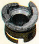
Brake Actuator 502681