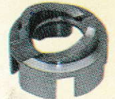
Roller Guide Ring 502682