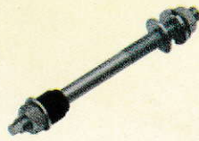
HUB AXLE F-5063