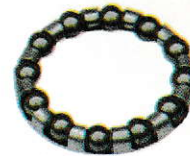
Ball Retainer (12 Balls) 503362