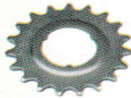
Sprocket (16T, 18T, 19T, 20T & 22T)